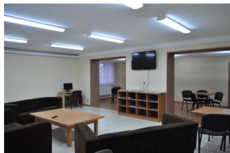
Pokój wypoczynkowy maturzystów