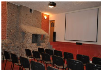
Sala kinowa Pracownia gastronomiczna