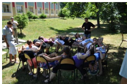
Projekt z programu „Młodzież w działaniu”